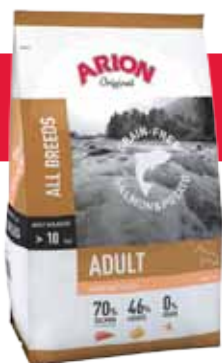
Envase 12 kg