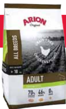
Envase 12 kg